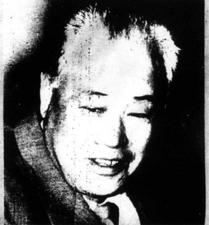
Mijail Gorbachov, Secretario General del PC de la URSS, y Zhao Ziyang, Primer Ministro chino.