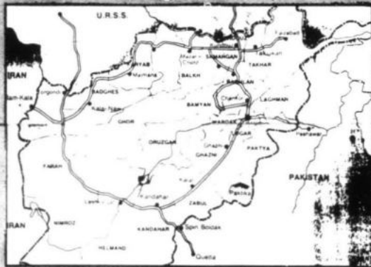
Los dirigentes chinos exigen el total retiro de las tropas vietnamitas de Kampuchea y similar actitud de las tropas soviéticas en Afganistán antes de iniciar cualquier intento de normalización entre ambos gigantes socialistas.