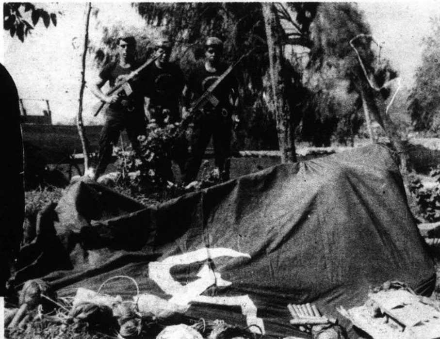
Sendero intenta rectificarse, pero primero debe enfrentarse a las deserciones en sus filas y a una práctica casi exclusivamente asesina.

Se quieren ir, y en más de una dirección de varios medios de información se ha visto el caso de importantes dirigentes senderistas que a cambio de contario todo, pedían se les socorriera para salir del país. Y muchos de ellos ostentaban —según aseguraban— cargos importantes en la jerarquía del Partido.