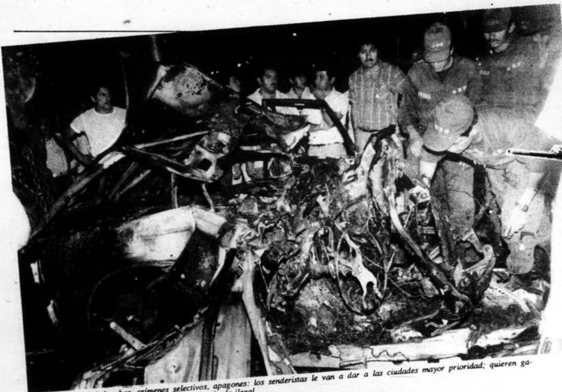
Cochebombas, crímenes selectivos, apagones: los senderistas le van a dar a las ciudades mayor prioridad; quieren ganarle al MRTA el espacio de la izquierda ilegal.