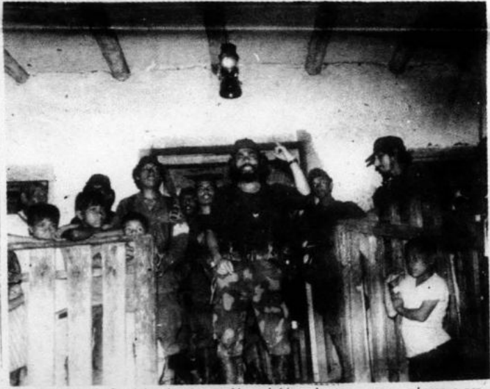
Con la toma de Juanjui y de otros pueblos selváticos, los tupacamaras echaron a perder de un plumazo el trabajo de los senderistas.

La acción del MRTA provocó un terremoto en IU y el APRA: los sectores donde Sendero ha puesto la mira.